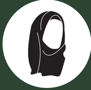
حوراء أحمد العيسى أخصائية إجتماعية لشؤون الأيتام