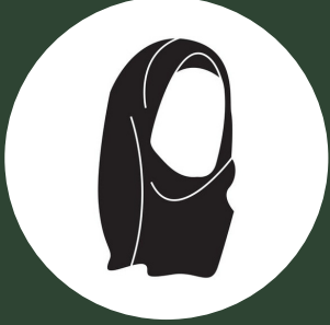
عرفات علي الرشيد باحثة اجتماعية